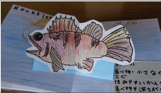
「とびだす佐渡の海の生き物」